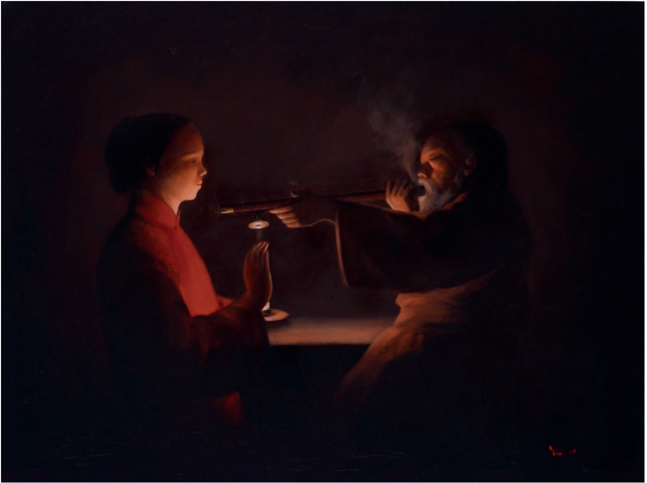
© Yin Xin Smoking opium in the dark, 2009 Acrylique sur toile / 130 x 97 cm