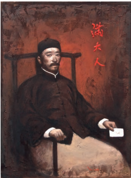
© Yin Xin D'après Vélasquez, Innocent X (1650), 2016 Acrylique sur toile / 100 x 81 cm