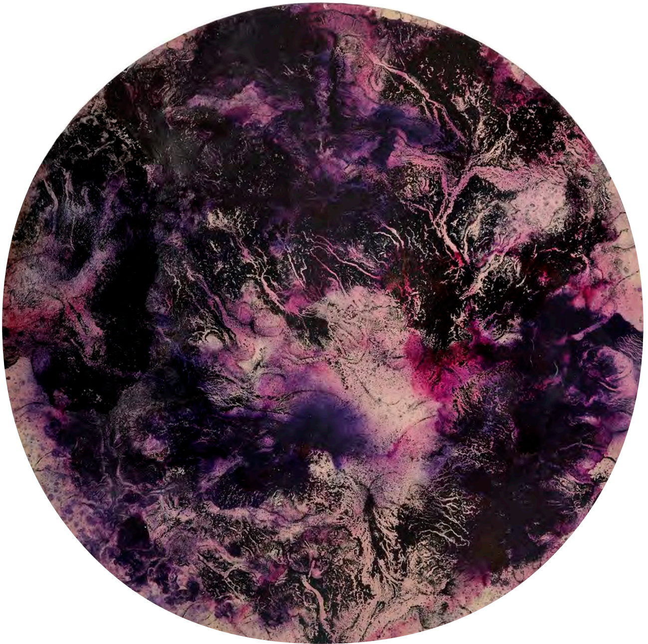
© Dan Barichasse. Tondo (2023), peinture sur papier marouflé sur nid d'abeille, dia. 122 cm