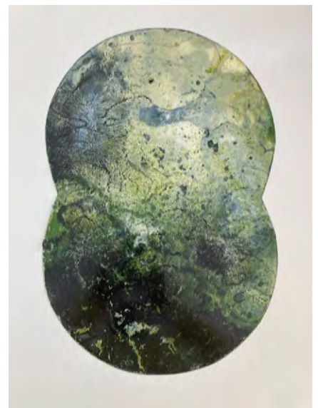
© Dan Barichasse. Tondos (2023), peintures sur papier marouflé sur nid d'abeille, dia. 122 cm