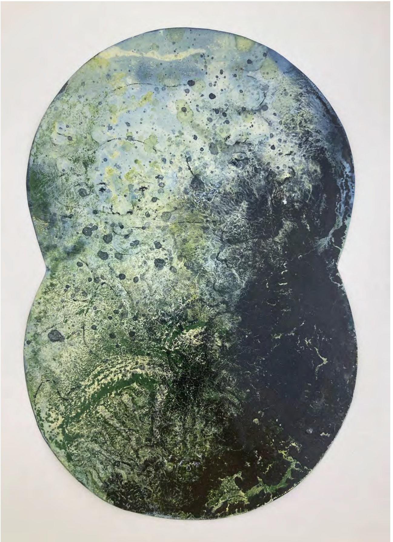
© Dan Barichasse. Double tondo (2013), peinture sur papier glacé, 45 × 30 cm